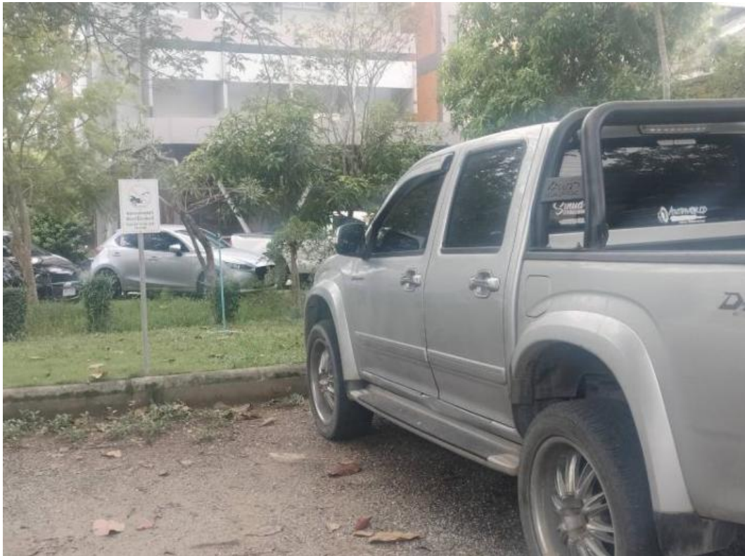
อาคาร 43 สำนักงานยานยนต์